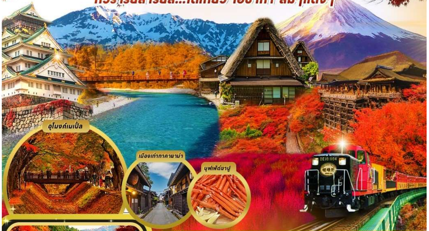
อุโมงค์เมบิอิล

ทัวร์ เรือล เรือล... โตเกียว โอซาก้า ส้ม ๆ แดง ๆ