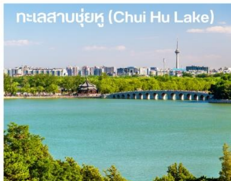
ทะเลสาบชู่หู (Chui Hu Lake)