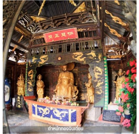
ตำหนักทองจีนเตี้ยน

นำท่านชมความงามของ ตำหนักทองจีนเตี้ยน ในอดีตเคยเป็นที่พักของอุ้ยฮั่นก๊วย “ขุนศึกผู้ขายชาติ” และนางงามเงินหยวนหยวน เป็นตำหนักที่มีฝ้าผนังและหลังคาสร้างด้วยทองเหลืองถึง 380 ตัน จึงทำให้ตำหนักมีความสวยเด่น แลดูเสมือนทอง จึงได้ชื่อว่า “ตำหนักทอง” นับได้ว่าเป็นตำหนักที่ใหญ่ที่สุดของจีน