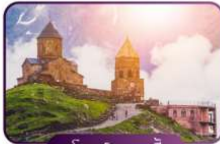
โบสถ์เกอเกดี