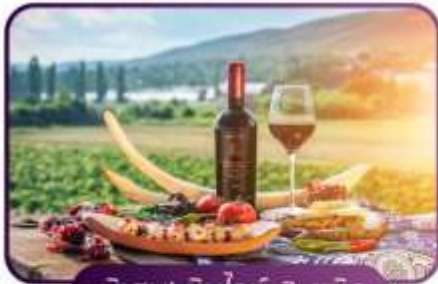
พิเศษ! ซิมไวน์ 3 ชมิด

แพคเกจเที่ยวสุดปังชมวิวหลักล้าน แคมฟรีเที่ยวอินเดีย 6 วัน 4 คืน BY 6E