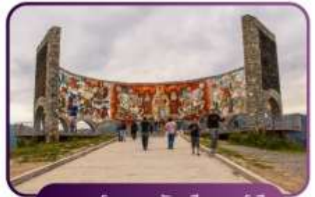
อนุสรณ์สถาน รัสเซีย จอร์เจีย

BKK 17:10 → 6E1054 → DEL 19:55 | DEL 20:10 → 6E1807 → TBS 00:45