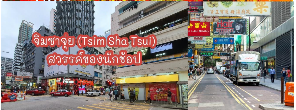
จิมซาจุ่ย (Tsim Sha Tsui) สวรรค์ของนักช้อปปิ้ง