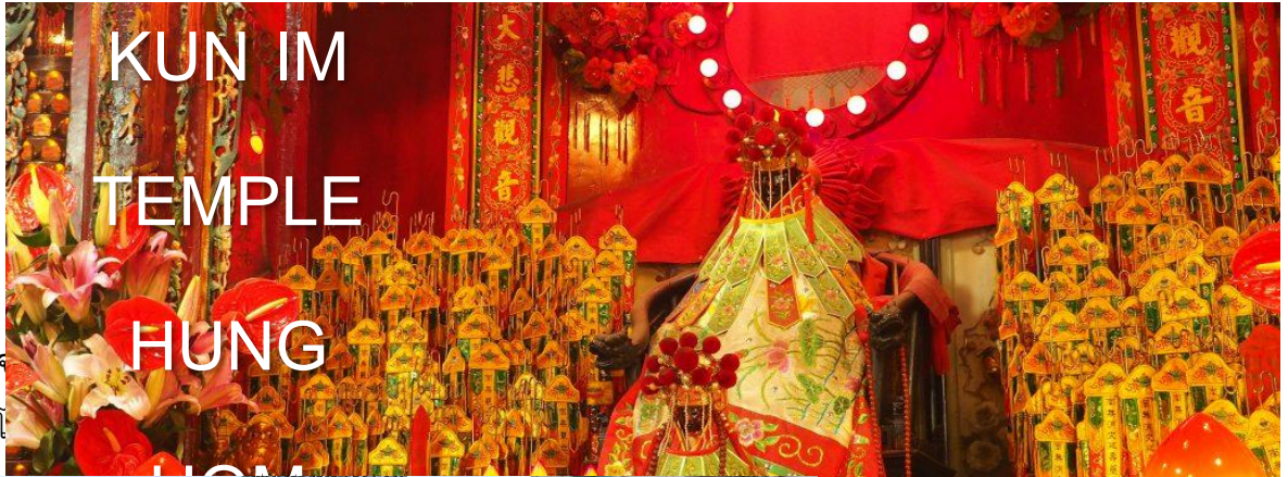
KUN IM TEMPLE HUNG

นำท่านชมวัด เจ้าแม่กวนอิมฮ่องกง เป็นวัดเจ้าแม่กวนอิมที่มีชื่อเสียงแห่งหนึ่งในฮ่องกง ขอพรเจ้าแม่กวนอิมพระโพธิสัตว์แห่งความเมตตา ช่วยคุ้มครองและปกป้องรักษาวัดเจ้าแม่กวนอิม เป็นวัดเก่าแก่ของฮ่องกงสร้างตั้งแต่ปี ค.ศ. 1873 ถึงแม้จะเป็นวัดขนาดเล็กที่ไม่ได้สวยงามมากมาย แต่เป็นวัดเจ้าแม่กวนอิมที่ชาวฮ่องกงนับถือมาก แทบทุกวันจะมีคนมาบูชาขอพรกันแน่นวัด