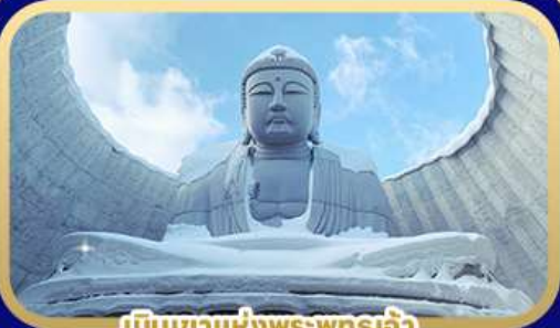
เป็นเขาแห่งพระพุทธเจ้า