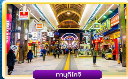
ทานุกิโคจิ