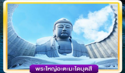
พระใหญ่อะตะมะไดบุตสึ