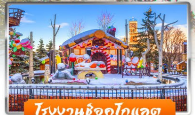
โรงงานช็อกโกแลต