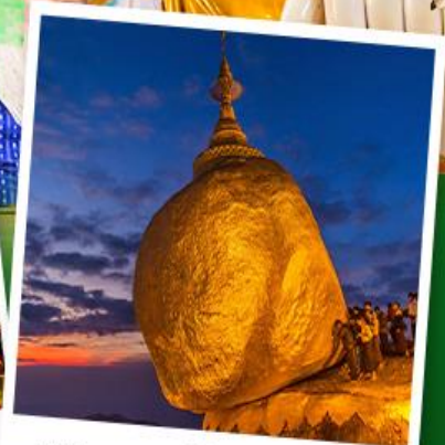
พระธาตุอินทร์แขวน