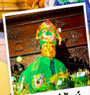
ขอฟรแม่ยักย์