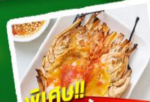
พิเศษ!! ก๊วยแม่น้ำ + HOTPOT SEAFOOD