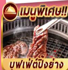
บุฟเฟ่ต์ปิ้งย่าง