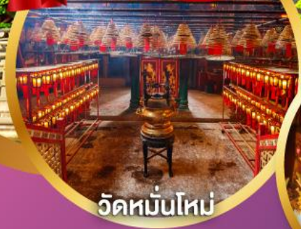
วัดหมื่นโหม่