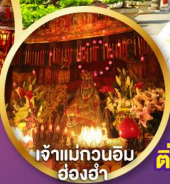
เจ้าแม่กวนอิม ฮ่องกง