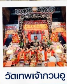
วัดเทพเจ้ากวนอู