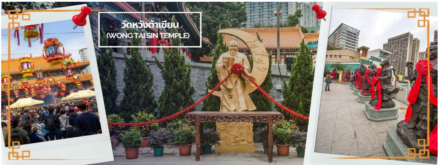
วัดหวังต้าเซียน (WONG TAI SIN TEMPLE)

ทอง มี เลี้ยวพระจันทร์อยู่ด้านหลัง เป้าหมายของคนโสดอยากมีคู่!!! โดยการขอพรกับเทพเจ้าองค์นี้ต้องใช้ ด้ายแดงผูกนิ้วเอาไว้ไม่ให้หลุดระหว่างพิธี เพราะชาวจีนเชื่อว่าด้ายแดงนี้แหละคือ เส้นโยงโชคชะตาด้านความรัก คนโสดก็เป็นการขอพรให้เจอเนื้อคู่ ส่วนคนมีคู่ ก็จะช่วยให้มีความรักที่มั่นคงและยืนยาว เมื่อไปถึงจะเห็น รูปปั้นของเทพหยกโคลวอยู่ตรงกลาง เมื่อหันหน้าเข้าหาเทพหยกโคลว จะพบรูปปั้นเจ้าบ่าว อยู่ทางขวา และรูปปั้นเจ้าสาวอยู่ทางซ้าย โดยมีด้ายแดงผูกโยงจากเจ้าบ่าวและเจ้าสาวมาที่เทพหยกโคลว ซึ่งท่านจะคอยทำหน้าที่ จดรายชื่อคู่รัก เชื่อกันว่าสมุดที่ผู้เฒ่าถือในมือ คือบัญชีรายชื่อคู่รักที่จะได้รับคำอวยพรให้อยู่คู่กันอย่างร่มเย็น เป็นสุข ซึ่งจะปรากฏตัวยามค่ำคืนภายใต้แสงจันทร์ เป็นเทพเจ้าผู้เป็นอมตะที่อาศัยอยู่บนดวงจันทร์ และลงมา โลกมนุษย์เพื่อผูกด้ายดวงชะตา ระหว่างคู่รักซึ่งเมื่อคู่กันแล้วก็จะไม่แคล้วคลาดกัน