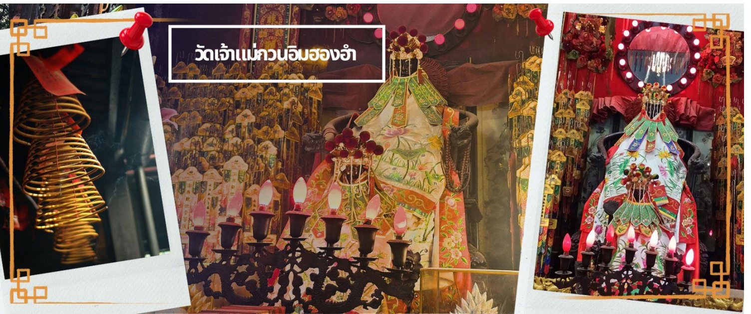
วัดเจ้าแม่กวนอิมสองฮ้า

จากนั้นนำทุกท่านเดินทางสู่ วัดเจ้าแม่กวนอิมสองฮ้า (HUNG HOM KWUN YUM TEMPLE) เป็นหนึ่งในวัดที่ชาวฮ่องกงนั้นเลื่อมใสกันมาก ด้วยความที่เจ้าแม่กวนอิมนั้นเป็นเทพเจ้าแห่งความเมตตา ฉะนั้นเมื่อใครมีทุกข์ร้อนอะไรก็มักจะมากกราบไหว้ขอพรให้เจ้าแม่ช่วยเหลือ วัดนี้ถูกสร้างขึ้นในปี ค.ศ.1873 ในช่วงสงครามโลกครั้งที่ 2 มีการปล่อยระเบิดลงบริเวณวัดฮ้องฮ้าหลายต่อหลายครั้ง ทำให้มีผู้บาดเจ็บและล้มตายมากมาย แต่ชาวบ้านที่หนีเข้าไปหลบภัยในวัดนี้ก็กลับปลอดภัยและตัววัดก็ไม่ได้รับความเสียหายจากเหตุการณ์ทิ้งระเบิดอย่างน่าอัศจรรย์ และวันสำคัญอีกวันหนึ่งที่คนฮ่องกงมาไหว้ขอพรอย่างไม่ขาดสาย และรอคอยเป็นประจำทุกปี ก็คือ "วันเปิดทรัพย์" หรือ วันยืมเงินเทพเจ้า เป็นวันที่จะมาขอพรและยืมเงินเจ้าแม่กวนอิม ซึ่งตรงกับวันที่ 26 นับจากวันตรุษจีน ซึ่งพิธีนี้ใน 1 ปี มีเพียงครั้งเดียวเท่านั้นจากนั้น