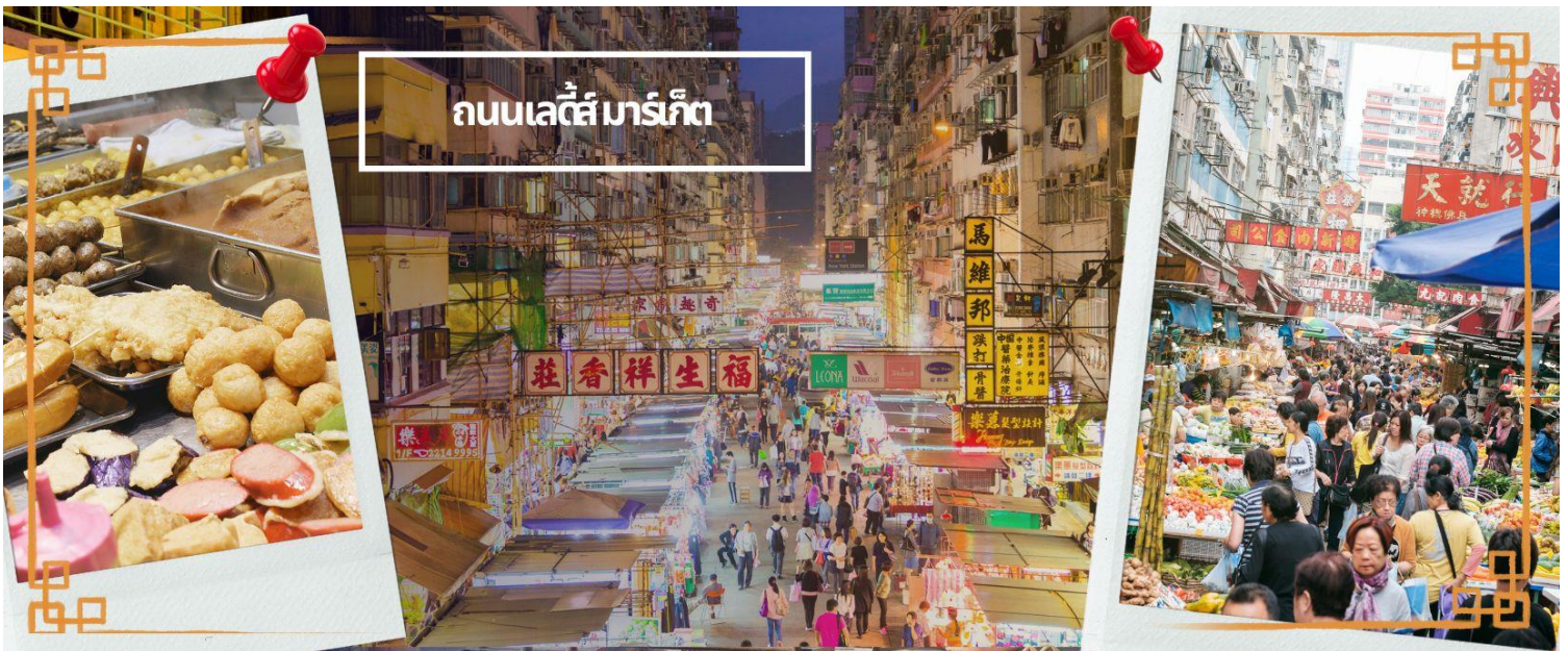
ถนนเลดีส์ มาร์เก็ต

จากนั้นนำท่านเดินทางสู่ ย่านมงก๊ก เป็นย่านที่มีความคึกคักที่สุดแห่งหนึ่งในเกาะฮ่องกงก็ว่าได้ เป็นสวรรค์ของนักช้อปปิ้งหนึ่งที่ ที่สายช้อปจะพลาดไม่ได้ นับได้ว่าเป็นย่านช้อปปิ้งที่คึกคักมากอีกแห่งหนึ่งของฮ่องกง เพราะเป็นย่านช้อปปิ้งที่มีทั้งร้านค้า และคนที่มาช้อปปิ้งจากที่ต่างๆ มากมายไม่ขาดสายตั้งแต่กลางวันยันกลางคืน เป็นถนนช้อปปิ้งที่มีสีสันมาก ถ้าเทียบกับญี่ปุ่นแล้วก็เปรียบเหมือนการเดินอยู่ที่ชิบูย่าเลยก็ว่าได้ และยังมี ถนนเลดีส์ มาร์เก็ต (LADIES MARKET) ที่มีทั้งเครื่องสำอาง เสื้อผ้า รองเท้า กระเป๋า เครื่องประดับมากมายให้เลือกซื้อ อีกทั้งยังมีร้านอาหารและ