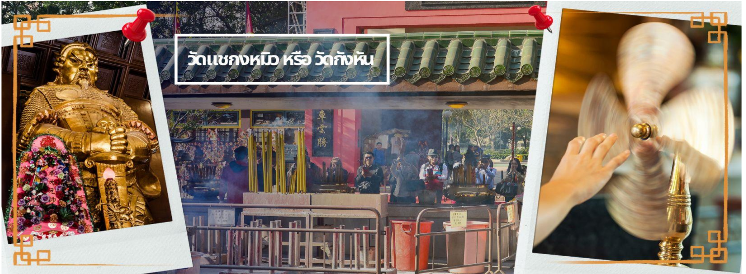
วัดเขกงหนือ หรือ วัดกั๊งหัน

จากนั้นนำท่านเดินทางสู่ ย่านมงก๊ก เป็นย่านที่มีความคึกคักที่สุดแห่งหนึ่งในเกาะฮ่องกงก็ว่าได้ เป็นสวรรค์ของนักช้อปปิ้งหนึ่งที่ ที่สายช้อปจะพลาดไม่ได้ นับได้ว่าเป็นย่านช้อปปิ้งที่คึกคักมากอีกแห่งหนึ่งของฮ่องกง เพราะเป็นย่านช้อปปิ้งที่มีทั้งร้านค้า และคนที่มาช้อปปิ้งจากที่ต่างๆ มากมายไม่ขาดสายตั้งแต่กลางวันยันกลางคืน เป็นถนนช้อปปิ้งที่มีสีสันมาก ถ้าเทียบกับญี่ปุ่นแล้วก็เปรียบเหมือนการเดินอยู่ที่ชิบูย่าเลยก็ว่าได้ และยังมี ถนนเลดีส์ มาร์เก็ต (LADIES MARKET) ที่มีทั้งเครื่องสำอาง เสื้อผ้า รองเท้า กระเป๋า เครื่องประดับมากมายให้เลือกซื้อ อีกทั้งยังมีร้านอาหารและ