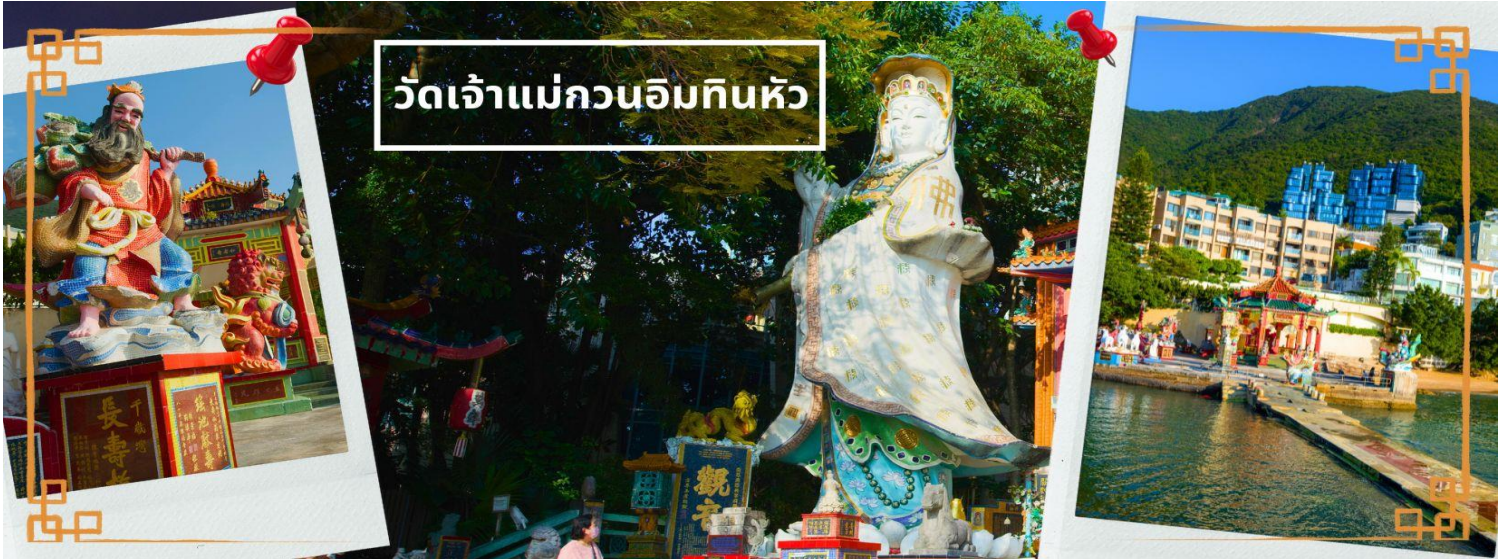
วัดเจ้าแม่กวนอิมกับหัว

เทพเจ้าแห่งความรัก ไหว้ขอเนือคู่, ศาลา 8 เหลี่ยม เชื่อกันว่าเป็นจุดที่มีดวงจ้ยดีที่สุด ภายในศาลาแปดเหลี่ยม จุดกึ่งกลางของพื้นจะมีรูปแปดเหลี่ยม ให้เราไปยื่นขอพรจากตำแหน่งนี้เพื่อขอพลังจากสวรรค์ และอีกมากมายให้ท่านได้สักการะบูชา