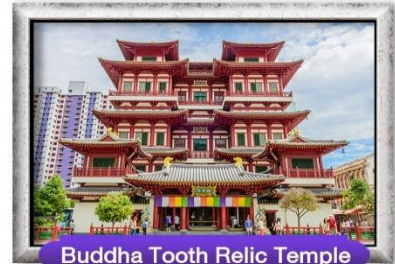
Buddha Tooth Relic Temple