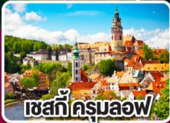
เชสกีครุมลอฟ

ฮังการี สโลวาเกีย ออสเตรีย เชก 7 วัน 4 คืน