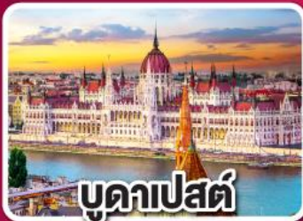
บูดาเปสต์