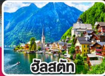
ฮัลสตัดท์