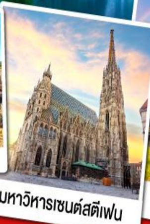
มหาวิหารเซนต์สตีเฟน