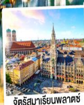
จัตุรัสมาเรียนพลาตซ์