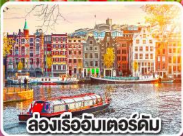
ล่องเรืออัมสเตอร์ดัม