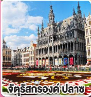
จัตุรัสกรองด์ปลาซ

ล่องเรือหลังคากระจก ชมความสวยงาม ของกรุงอัมสเตอร์ดัม