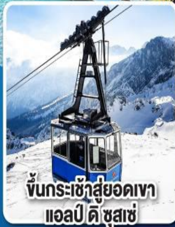
ขึ้นกระเช้าสู่ยอดเขา แอลป์ ดี ซูสเซ่

เที่ยวเมืองอินส์บรุค เพชรเม็ดงามสุดโรแมนติก แห่งแคว้นทีโรล ราคาเริ่มต้น