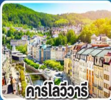
คาร์ลส์บอด