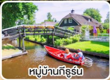
หมู่บ้านทึร์น