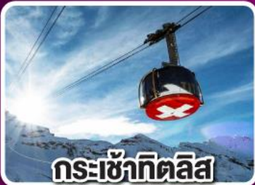
กระเช้าทิคิลิส