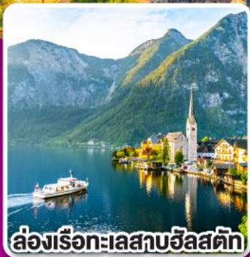
ล่องเรือทะเลสาบฮัลสตัดท์

พิเศษ! เมนูชีสฟองดัวร์ เปิดปีกกิ้ง และ ชุปกุลาช