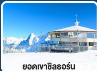
ยอดเขาซิลลอร์ด