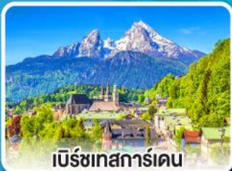
เบิร์ชเทสการ์เดน