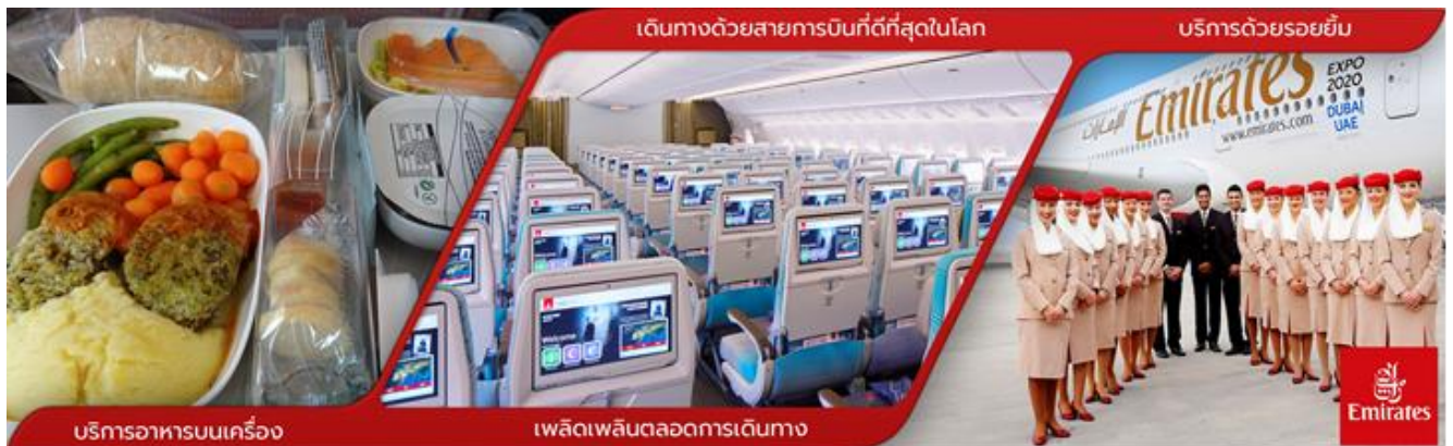
บริการอาหารบนเครื่อง

23:30 น. คณะผู้เดินทางพร้อมกัน ณ สนามบินสุวรรณภูมิ อาคารผู้โดยสารขาออกระหว่างประเทศ ชั้น 4 ประตูทางเข้าที่ 7-8 แถว บ เคาน์เตอร์สายการบินเอมิเรต (EMIRATES) ซึ่งมีเจ้าหน้าที่บริษัทฯ คอยให้การต้อนรับพร้อมอำนวยความสะดวกด้านสัมภาระแก่ท่าน