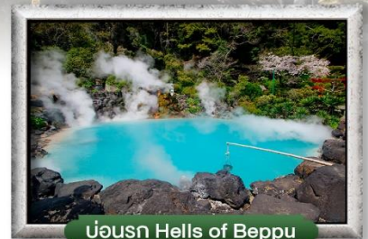
บ่อน้ำ Hells of Beppu