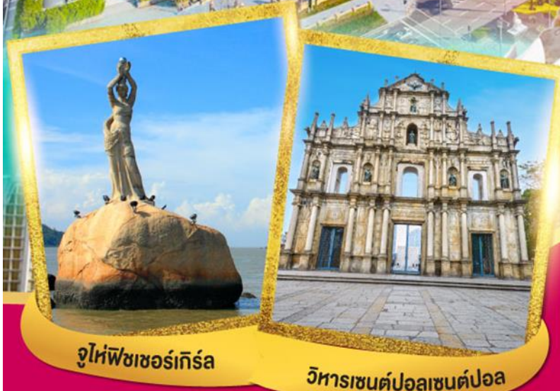
จูไห่พีซเซอร์เกิร์ล