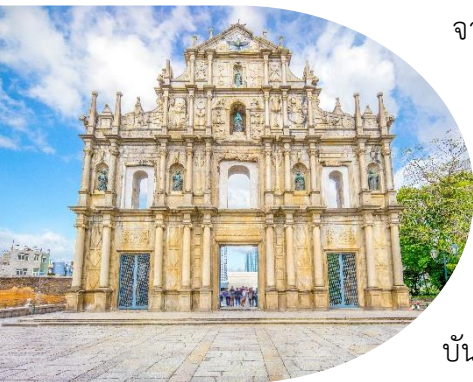
แห่งเดียวเท่านั้นในโลก

หมายเหตุ: เนื่องจาก เจ้าแม่กวนอิมริมทะเล อยู่ระหว่างการซ่อมบำรุง ตั้งแต่ตอนนี้จนถึงเดือน เมษายน 2567 กรุณ ันวันที่เดินทางยังซ่อมบำรุงไม่เรียบร้อย ทางบริษัทขอสงวนสิทธิ์ ในการนำท่านเดินทางสู่ ไทเปสตรีทฟู้ด ถนนที่เต็มไปด้วยร้านอาหาร ขนม ของอร่อยเมืองมาเก๊า ทดแทน