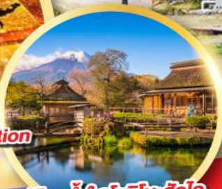
หมู่บ้านน้ำใส โอชิโนะซึกุไก