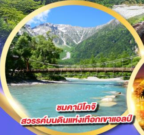
ชมคามิโคจิ สวรรค์บนดินแห่งเทือกเขาแอลป์

นั่งกระเช้าลอยฟ้า 2 ชั้น ชินโฮทากะ หนึ่งเดียวในญี่ปุ่น แลนด์มาร์กยอดฮิตของโอคุซึดะ