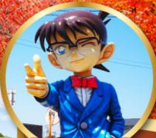
โคนันทาวน์