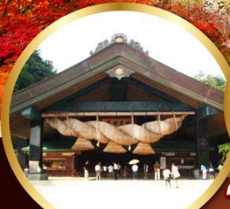
ศาลเจ้าอิชิโมะโกะ