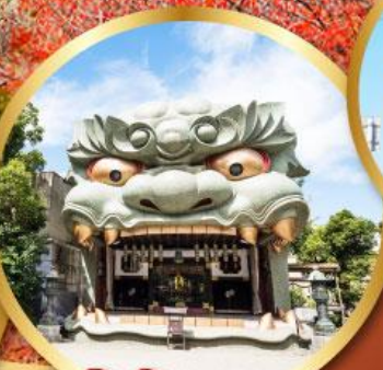
ศาลเจ้านิมะ ยาชากะ