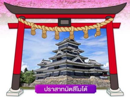
ปราสาทมัตสึโมโด้