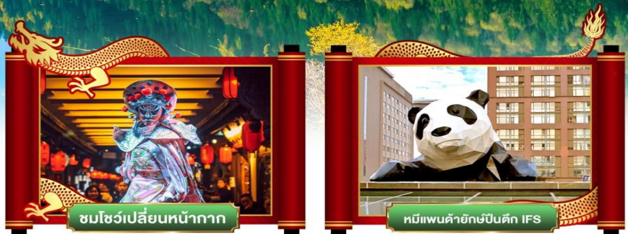
ชมโชว์เปลี่ยนหน้ากาก