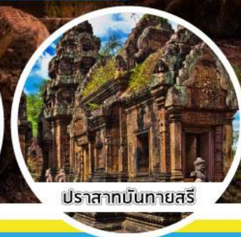
ปราสาทบันทายศรี