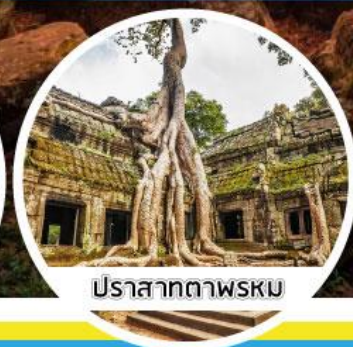
ปราสาทตาพรหม