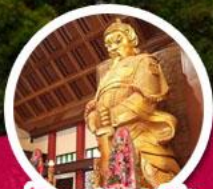
วัดแฉกหมิว