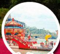
ริพลีสเบย์