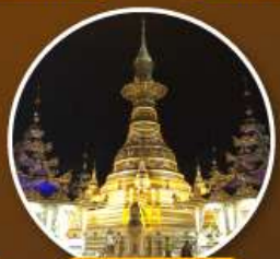
เจดีย์เอ่งดอหย่า