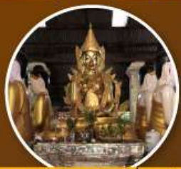
พระพุทธรูปม่านอ่อนหมื่นสะจำซัน