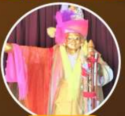
เทพทันใจ โจ๊ะซ่า