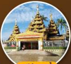
เจดีย์กลางน้ำ