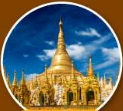
เจดีย์ชเวดากอง