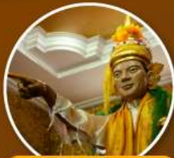
เทพทันใจ วัดโบตาทาวน์