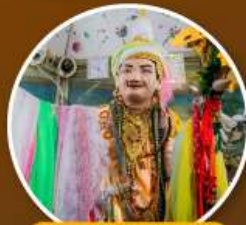
เทพทันใจ เจดีย์ซุหลอ