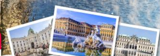
ถ่ายรูปคู่พระราชวังฮอฟบวร์ค และ พระราชวังเบลวิเดียร์ เข้าชมความสวยงามของพระราชวังเซ็นบรุนน์