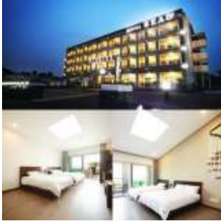
นำเข้าพักที่ Sea & Hotel หรือเทียบเท่า

ถึงแม้ว่าซั่มกยอบซัลจะมีการเตรียมการที่สุตแสนจะธรรมดา คือไม่ได้มีการหมักหรือมีส่วนผสมที่หลากหลาย แต่ว่าถ้าพุดถึงรสชาติแล้ว นับว่าพลาดไม่ได้เลย