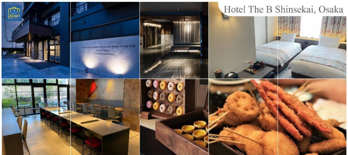
Hotel The B Shinsekai, Osaka

พักที่ HOTEL THE B SHINSEKAI, OSAKA หรือเทียบเท่าระดับเดียวกัน