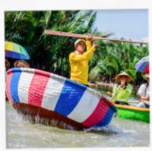
ล่องเรือกระดิง