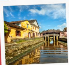
เมืองโบราณฮอยอัน