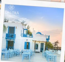
ซานตารีน่าคาเฟ่