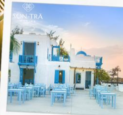
ซานตราน่าคาเฟ่