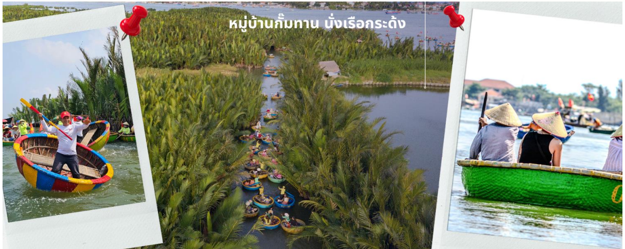
หมู่บ้านกัมกาน มั่งเรือกระดัง

จากนั้นนำท่านเดินทางสู่ เมืองฮอยอัน เทียบชมเมืองมรดกโลกทางวัฒนธรรมได้รับการขึ้นทะเบียนจาก UNESCO มนต์เสน่ห์อยู่ที่บ้านโบราณซึ่งอายุเก่าแก่กว่า 200 ปี มีหลังคา ทรงกระดองปู แบบเฉพาะของเมืองฮอยอัน ซึ่งเป็น สถาปัตยกรรมที่ไม่ซ้ำแบบทั้งในด้านศิลปะและการแกะสลัก ชมย่านการค้าเมืองท่าค้าขายสมัยโบราณของชาวจีน **เมืองฮอยอัน ไม่อนุญาตให้นักท่องเที่ยวเข้าไปตั้งนั้นการเดินทางชมเมืองจึงเป็นวิธีท่องเที่ยวที่ดีที่สุด** นำท่านชม สะพานญี่ปุ่น ซึ่งเป็น พิพิธภัณฑ์ประวัติศาสตร์วัดกวนอู ศาลเจ้า ชุมชนชาวจีน และ บ้านโบราณ อายุยาวนานกว่า200ปีซึ่งสร้างในแบบผสมผสานสถาปัตยกรรมที่ยังคงเหลือเข้าเมื่อศตวรรษที่ 17