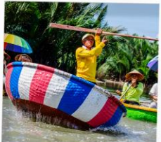
เรือกระดัง