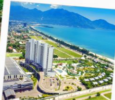
Mikazuki Japanese Resorts & Spa