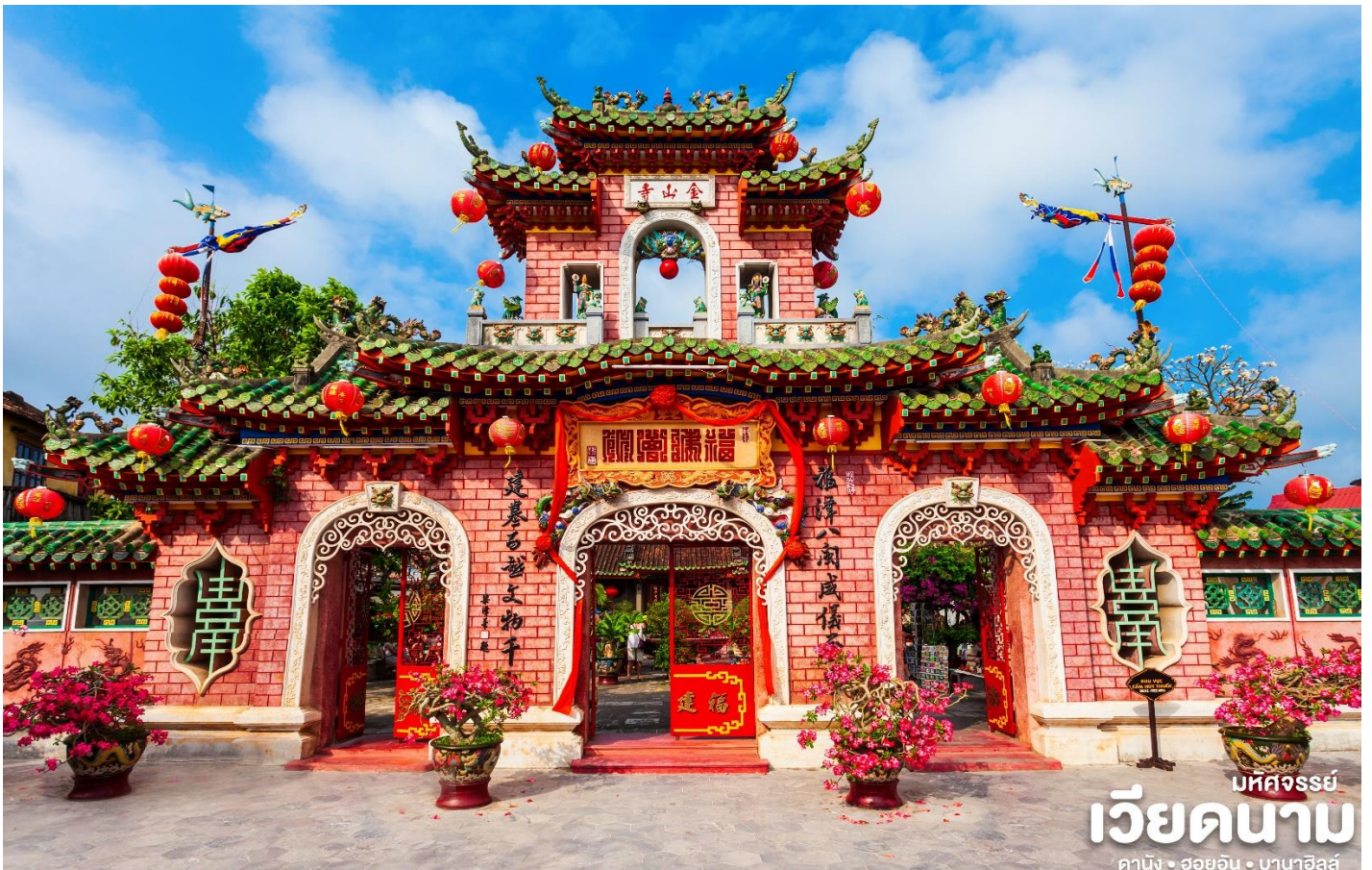
เวียดนาม ดานัง • ฮอยอัน • บานาฮิลล์

นำท่านชม วัดจีน เป็นสมาคมชาวจีนที่ใหญ่และเก่าแก่ที่สุดของเมืองฮอยอันใช้เป็นที่พบปะของคนหลายรุ่น วัดนี้มีจุดเด่นอยู่ทำงานไม้แกะสลักลวดลายสวยงามท่าน สามารถทำบุญต่ออายุโดยพิธีสมัยโบราณ คือ การนำรูปที่ขุดเป็นก้อนหอย มาจุดทิ้งไว้เพื่อ เป็นสิริมงคลแก่ท่าน