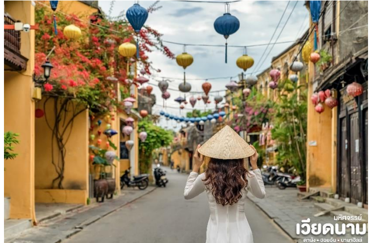
เวียดนาม ดานัง • ฮอยอัน • บานาฮิลล์

เมืองฮอยอันนั้นอดีตเคยเป็นเมืองท่า การค้าที่สำคัญแห่งหนึ่งในเอเชียตะวันออกเฉียงใต้และเป็นศูนย์กลางของการ แลกเปลี่ยนวัฒนธรรมระหว่างตะวันตกกับตะวันออกองค์การยูเนสโกได้ประกาศให้ฮอยอันเป็นเมืองมรดกโลกทางวัฒนธรรมเนื่องจากเป็นสถานที่สำคัญทางประวัติศาสตร์ แม้ว่าจะผ่านการบูรณะขึ้นเรื่อยๆ แต่ก็ยังคงรูปแบบของเมืองฮอยอันไว้ได้