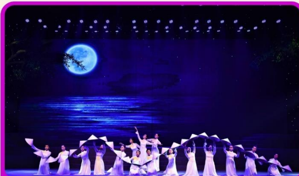
ชมการแสดง Charming Show Danang