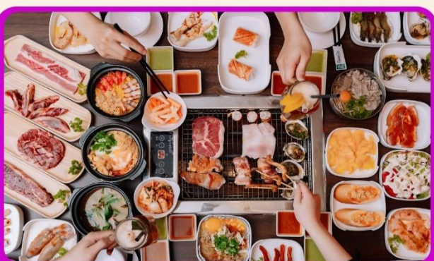
พิเศษ!! เมบูซาซิมิ+บุฟเฟ่ต์ปิ้งย่าง