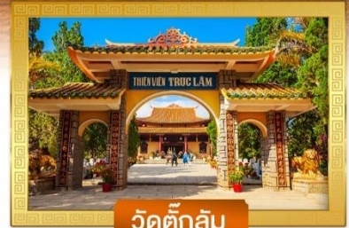
วัดตึกล้ม