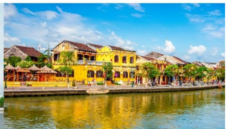
หมู่บ้านฮอยอัน

*กรณีห้องพักรับบานาฮิลล์เต็ม ขอสงวนสิทธิ์ในการเปลี่ยนวันเข้าพัก และปรับเปลี่ยนโปรแกรมโดยคำนึงถึงผลประโยชน์ลูกค้าเป็นสำคัญ