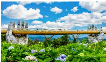
สะพานมือบานาฮิลล์