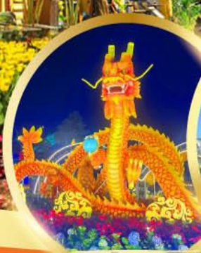
สะพานมังกรพันไฟ