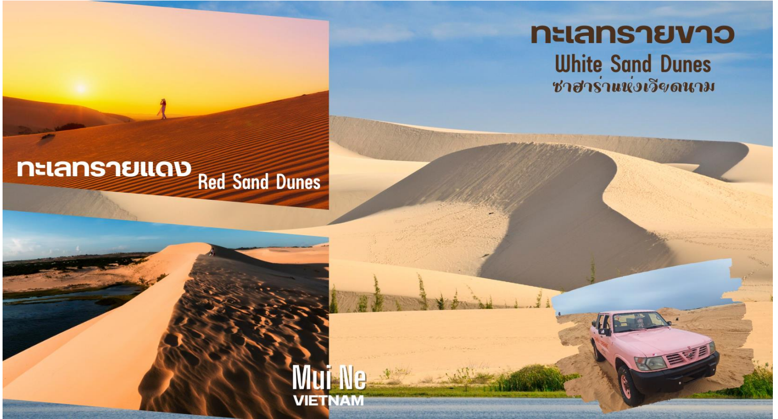
ทะเลทรายแดง Red Sand Dunes

จากนั้นชมและสัมผัสความยิ่งใหญ่เม็ดทรายละเอียดสีขาวของ ทะเลทรายขาว (White Sand Dunes) หรือที่เรียกว่าทะเลทรายขาวทะเลทรายที่ใหญ่ที่สุดของเวียดนามหรือ ซาฮาร่าแห่งเวียดนาม (แถมฟรีคาร์ตจีพท์เที่ยวชมทะเลทราย)