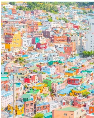
(Songdo Turtle Island) และไปสิ้นสุดที่บริเวณริม ชายหาดชงโด

พาทุกท่านเดินทางสู่ Gamcheon Culture Village (หมู่บ้านวัฒนธรรมคัมซอน) เป็นหมู่บ้านที่เกิดจากการตั้งรกราก ย้ายถิ่นฐานของชาวเกาหลี ซึ่งหนีภัยจากสงครามเกาหลี ในระหว่างปี ค.ศ. 1950 - 1953 และอาศัยอยู่จนถึงปัจจุบัน ด้วยลักษณะการสร้างบ้านเรือนผ่านถนนทุกสายที่เรียงรายไปตามแนวภูเขา จนเป็นชั้นบันไดที่เป็นระเบียบ และดูสวยงามแปลกตา ไปกับสีสันที่สลับไปมาของตัวบ้านและหลังคา จึงกลายเป็นเอกลักษณ์สำคัญของหมู่บ้านแห่งนี้ จนได้รับฉายาว่า “มาชูปิกชูแห่งปูซาน” (Machu Picchu of Busan) ในปี ค.ศ. 2015 นอกเหนือไปจากความสวยงามแปลกตา ของหมู่บ้านแห่งนี้แล้ว ภายในหมู่บ้านยังมีสถานที่ และสิ่งอำนวยความสะดวก ซึ่งทำให้คุณเพลิดเพลิน กับการเดินท่องเที่ยวภายในหมู่บ้าน ได้แก่ พิพิธภัณฑ์ขนาดเล็ก, ร้านศิลปะ, ร้านขายของที่ระลึก, คาเฟ่, ร้านกาแฟ, ร้านอาหารหลากหลายประเภท และอื่น ๆ อีกมากมาย