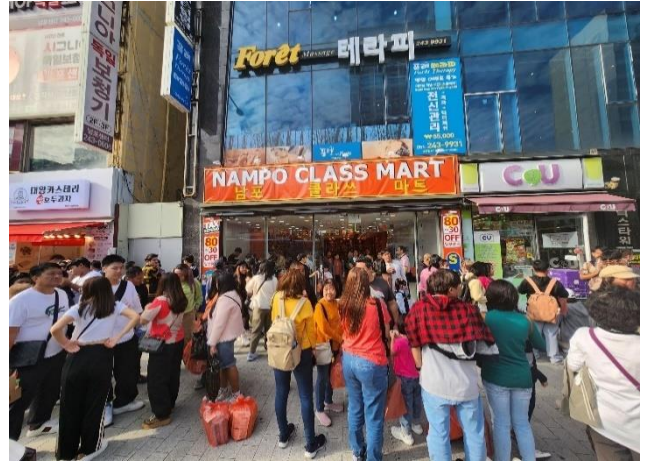
ตลาดตลาดวอลด์กังสตรีทนัมโพดง(Nampodong)

แหล่งช้อปปิ้งปูซาน แหล่งช้อปปิ้งอันดับต้น ๆ ที่ชาช้อปปิ้งแหกทั้งหลายรู้จักกันเป็นอย่างดี เพราะย่านนี้ถือเป็นศูนย์รวมแฟชั่นชั้นนำของหนุ่มสาวปูซาน และนักท่องเที่ยวเลยก็ว่าได้ หากอยากดูเทรนด์การแต่งตัว เหล่าสาวหน้าแต่ง หรือจะมอมหนุ่มหน้าใส มาที่นี่รับรองว่าไม่ผิดหวังแน่ละ ถ้าจะให้เปรียบก็คล้ายๆกับย่านสยามของบ้านเรานั่นเอง รวมถึงอาหารฟู้ดสตรีท อาหารท้องถิ่นต่าง ๆ อีกเพียบ รวมทั้งมีร้านช้อปปิ้งของฝากชื่อดัง Nampodong Class Mart ไปละลายเงินวอนกันได้เลย