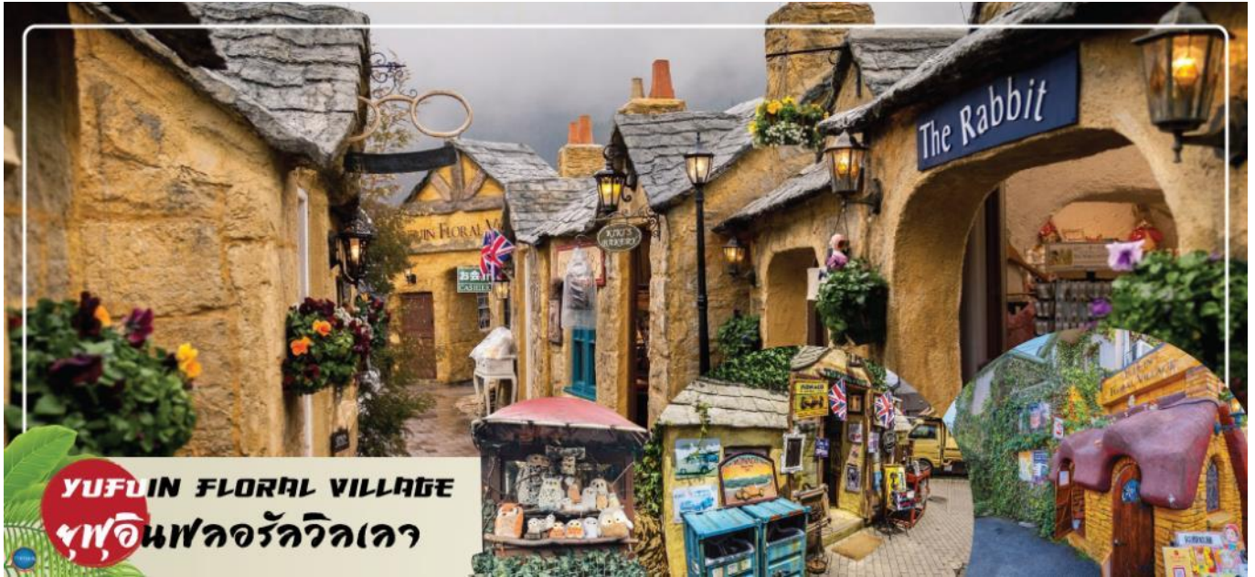
YUFUIN FLORAL VILLAGE ฟูอินฟลอรัลวิลเลจ