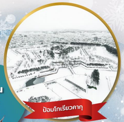
ป้อมโกเรียวกากุ

หมู่บ้านนิงเกิลเทอเรส • สวนสัตว์อาซาฮิยาม่า • ชมขบวนพาเหรดเพนกวิน ตลาดเช้าฮาโกดาเตะ • ป้อมโกเรียวกากุ • นั่งกระเช้าชมเมืองฮาโกดาเตะ ลานสกี • HILL OF BUDDHA • โอตารุ • คลองโอตารุ • หมู่บ้านรามเม