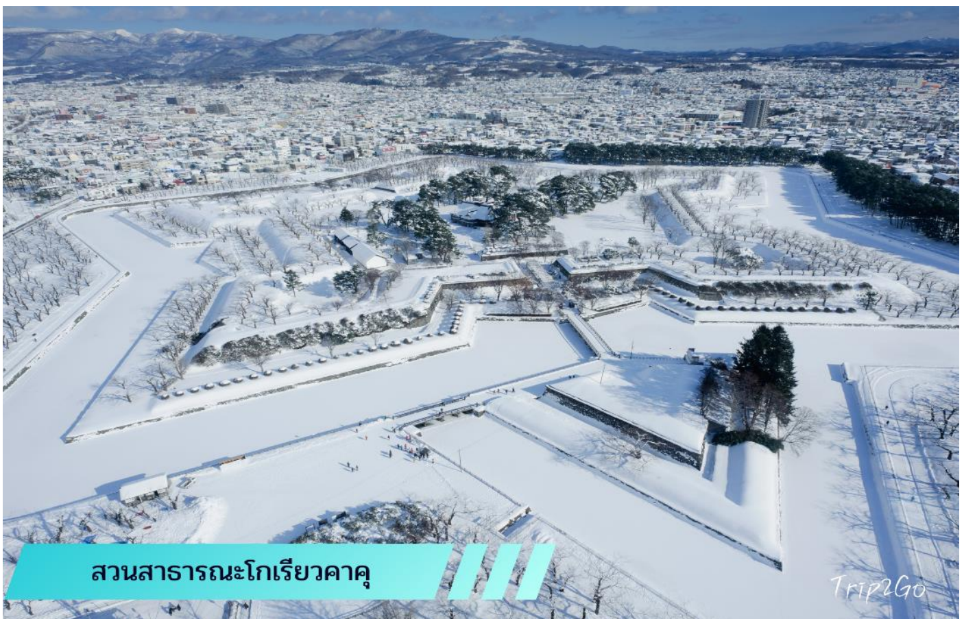
สวนสาธารณะโกเรียวกาคู

นำท่านสู่ ตลาดเช้าฮาโกดาเตะ (HAKODATE MORNING MARKET) ตลาดสดยามเช้าที่โด่งดังในหมู่นักท่องเที่ยวตั้งอยู่ที่ เมืองฮาโกดาเตะ (Hakodate) นับเป็นตลาดยามเช้าที่ผู้คนต่างหลั่งไหลเข้ามาจับจ่ายซื้อของ ทั้งอาหารสดอาหารแห้ง ร้านขายของ ภายในตลาดเต็มไปด้วยร้านขายอาหารทะเลสด หรือจะเป็นผลไม้ต่างๆ ตามฤดูกาล ที่มีให้นักท่องเที่ยวได้เลือกซื้อกลับไปเป็นของฝากอีกเพียบ จากนั้น เดินทางเข้าสู่ บ่อมปราการโกเรียวกาคู (GORYOKAKU) ตั้งอยู่ใจกลางเมืองฮาโกดาเตะ เมื่อมองจากการออกแบบห้าด้านแล้ว จะเห็นได้ชัดว่าเป็นบ่อมปราการทรงดวงดาว เพราะบ่อมปราการแห่งนี้ได้รับการออกแบบโดยทาเคดะ อะยะซะบุโระ และได้รับอิทธิพลทางการออกแบบจากเวบบัน วิศวกรทางทหารชาวฝรั่งเศสบ่อมแห่งนี้ เป็นบ่อมปราการแห่งแรกในรูปแบบตะวันตกในประเทศญี่ปุ่น บ่อมแห่งนี้ได้สร้างเสร็จในปี ค.ศ.1864 (ราคาทัวร์ไม่รวมค่าลิฟต์ขึ้นชมหอคอย คนละประมาณ 800 เยน)