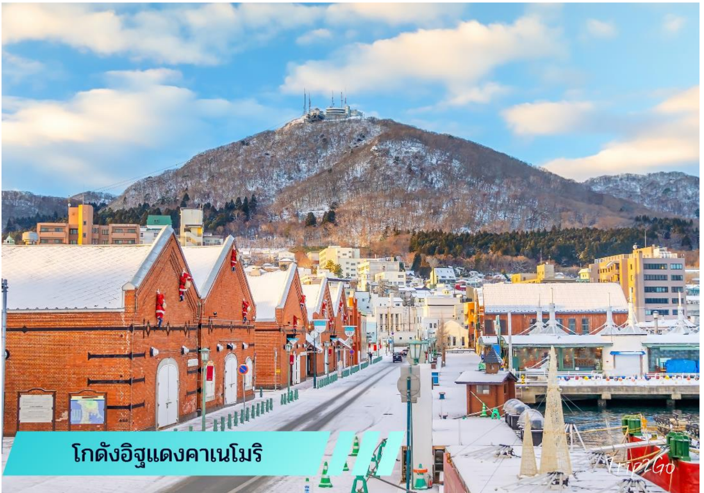
โกดังอิฐแดงคานะโมริ

เที่ยง 10/ บริการอาหารเที่ยง ณ ภัตตาคาร (6)