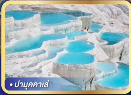
• ปามุกคาเล่