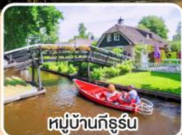
หมู่บ้านกีร์รุ่น