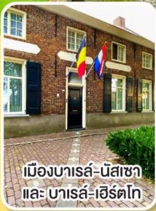
เมืองบารส์-นัสซา และ บารส์-เฮิร์ตโท