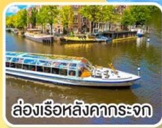
ล่องเรือหลังคากระจก

พิเศษ!! เมนูหอยแมลงภู่อบไวน์ขาว ล่องเรือหมู่บ้านไรกนบน ที่รูร์น