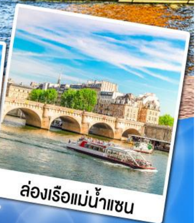
ล่องเรือแม่น้ำแซน

23-29 ก.ย. 67 07-13, 21-27 ต.ค. 67 04-10, 18-24 พ.ย. 67 02-08 ธ.ค. 67