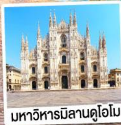
มหาวิหารมิลานดูโอโม

เมนูพิเศษ!! หอยแอสคาโก้ อาหารไทย, ฟองดูชีส