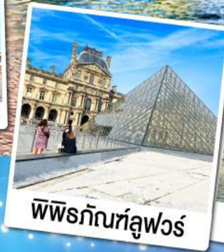
พีพีรภัณฑุลูฟวร์