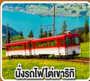
นั่งรถไฟใต้เขาริก