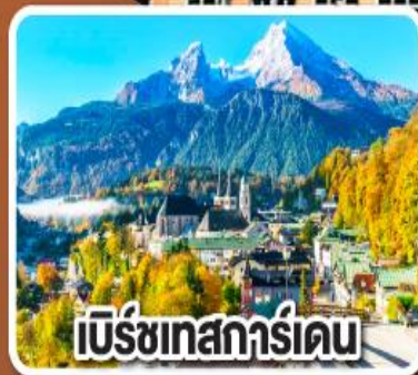
เบิร์ชเทสการ์เดน

เข้าชมเมืองกล็อบราท แห่งเมืองเบิร์ชเทสการ์เดน